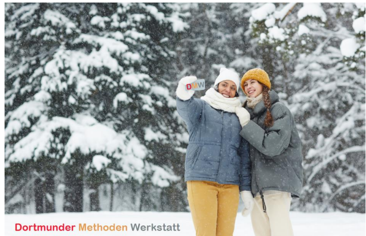
Dortmunder Methoden Werkstatt

Ankündigung online Winter School 24. Februar bis 25. März 2022